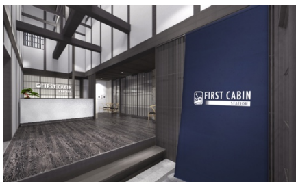
京町家の小屋組を生かしたフロントエリア