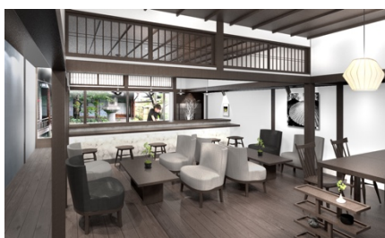
外部からも利用可能なカフェを併設